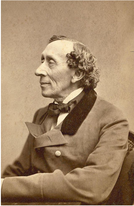
Hans Christian Andersen (1805-1875), dán