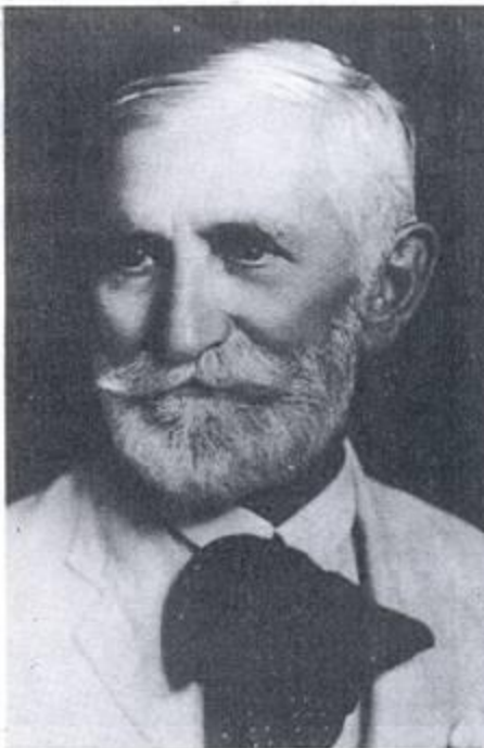
Benedek Elek (1859-1929), magyar