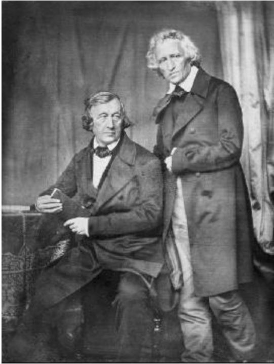
Jacob Grimm (1785-1863), német