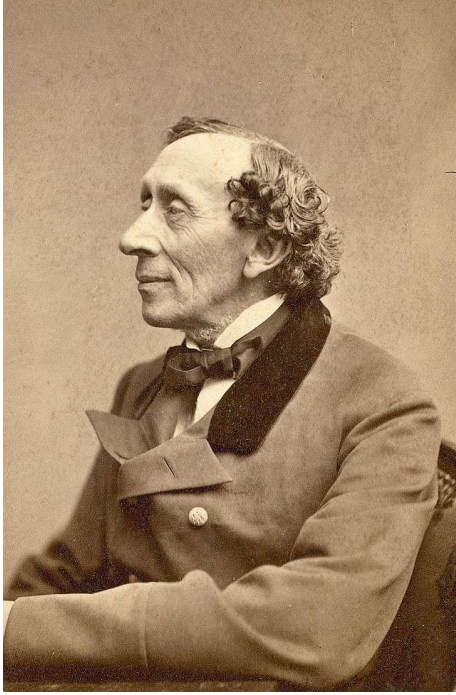
Hans Christian Andersen (1805-1875), dán