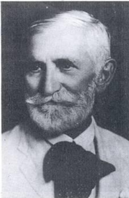
Benedek Elek (1859-1929), magyar