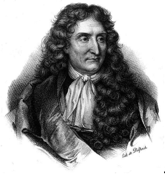
Jean de La Fontaine (1621 – 1695), francia