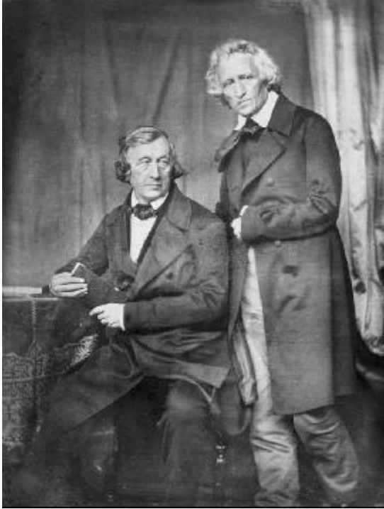
Jacob Grimm (1785-1863), német